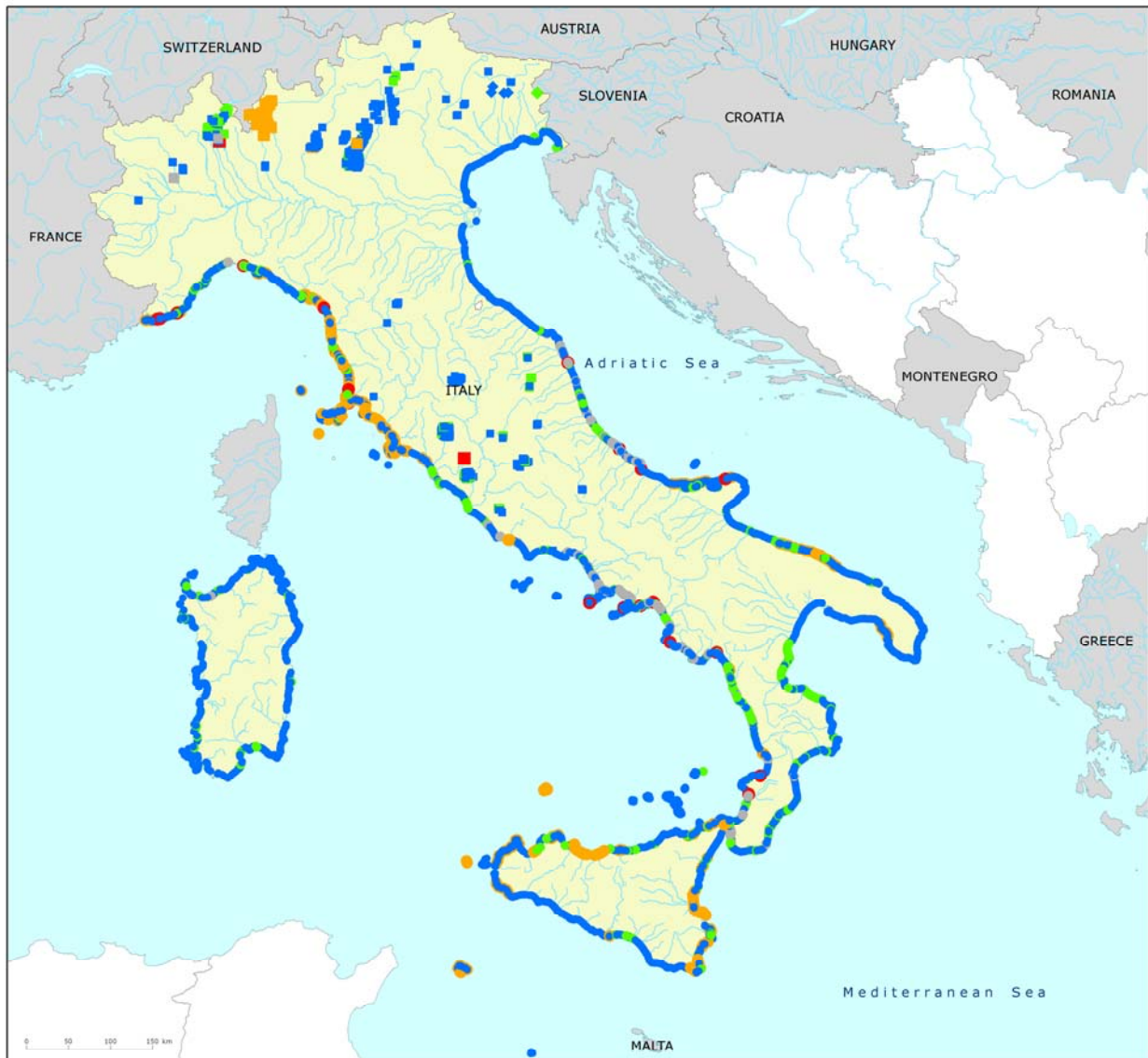
Map 1: Bathing waters reported during the 2011 bathing season in Italy